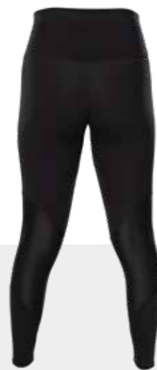
DOS | BACK