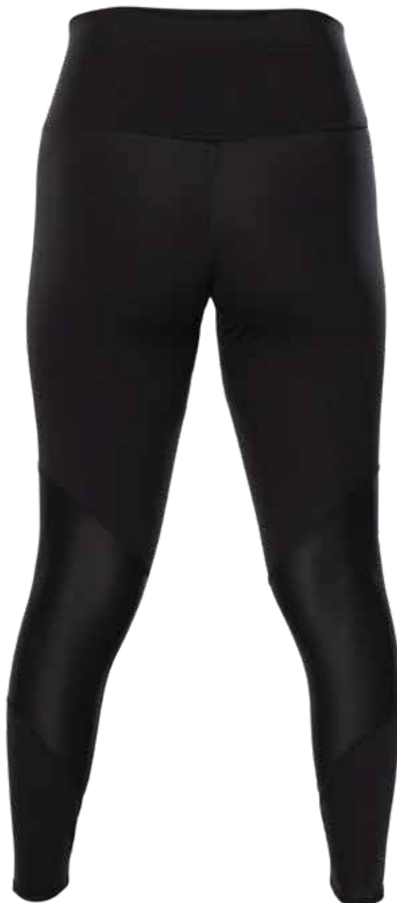
NOIR | BLACK - DOS | BACK