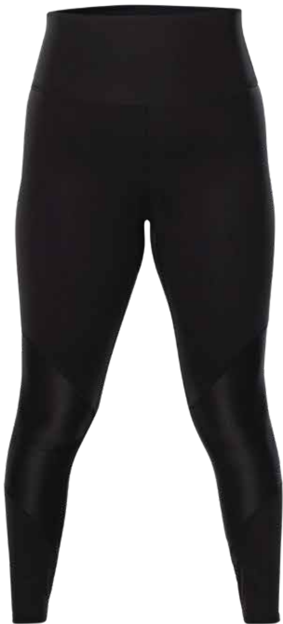
NOIR | BLACK - DEVANT | FRONT