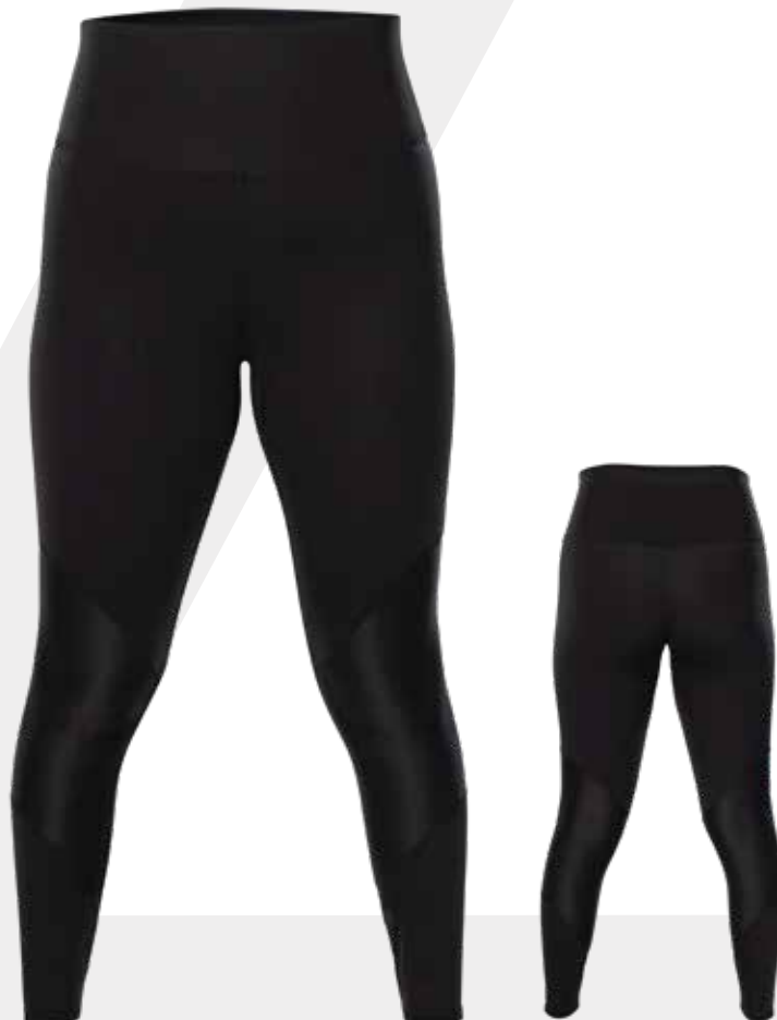
DEVANT | FRONT