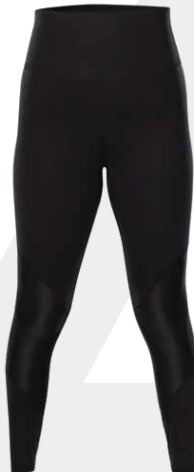
DEVANT | FRONT