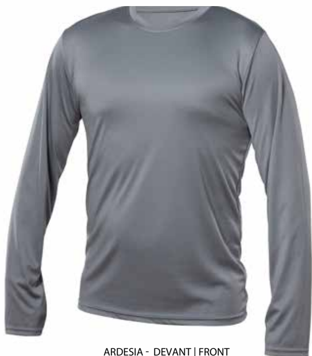
ARDESIA - DEVANT | FRONT