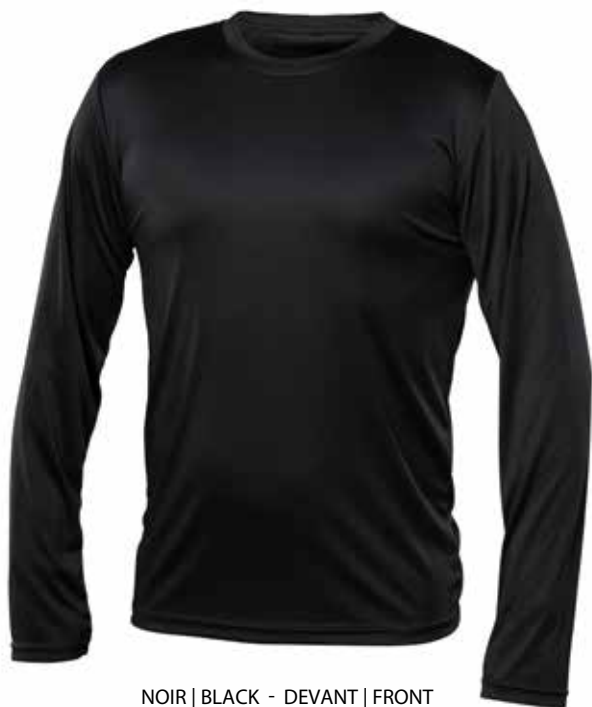
NOIR | BLACK - DEVANT | FRONT