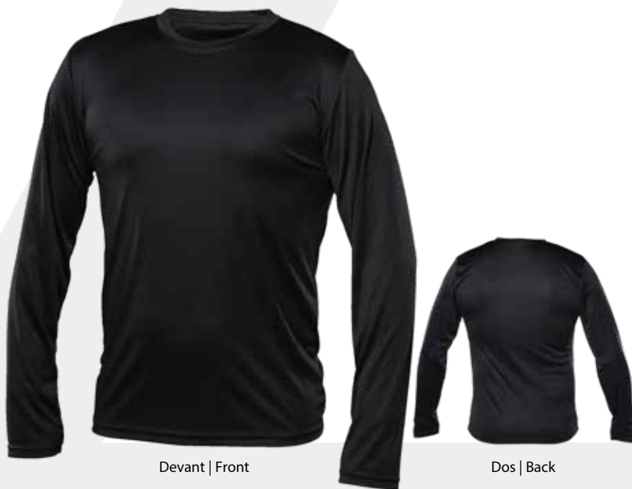
Devant | Front

Due to the nature of 100% polyester fabrics, special care must be taken throughout the screen printing process. Please read carefully instructions on page 2.