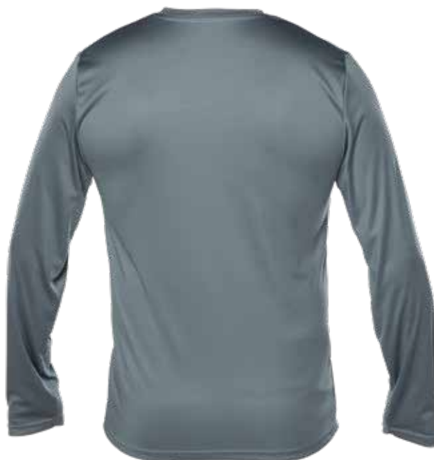
ARDESIA - DOS | BACK