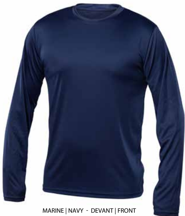
MARINE | NAVY - DEVANT | FRONT