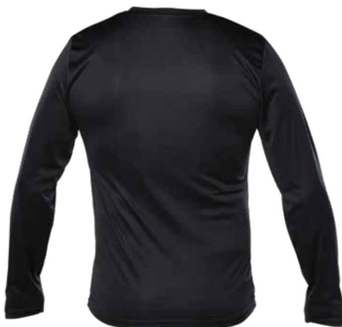
NOIR | BLACK - DOS | BACK