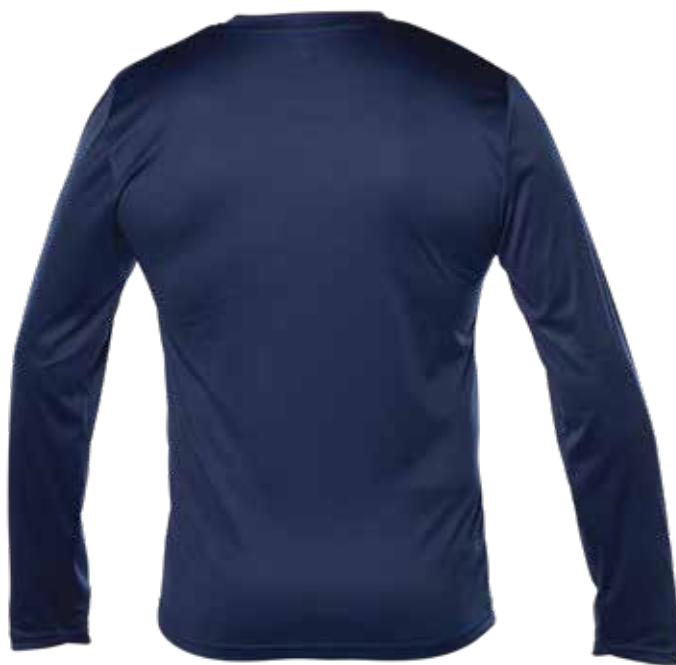
MARINE | NAVY - DOS | BACK