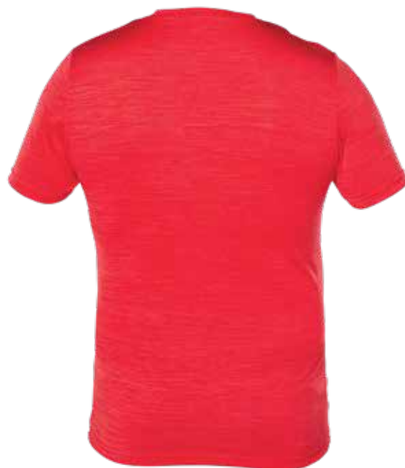
MIX ROUGE | MIX RED - DOS | BACK