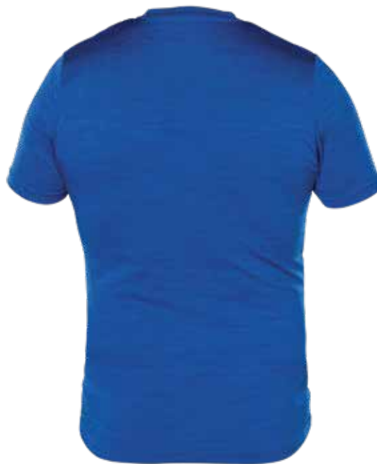
MIX BLEU | MIX BLUE - DOS | BACK