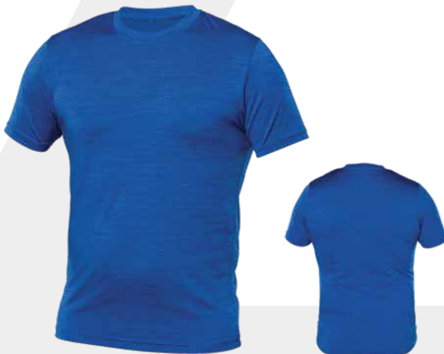
DEVANT | FRONT