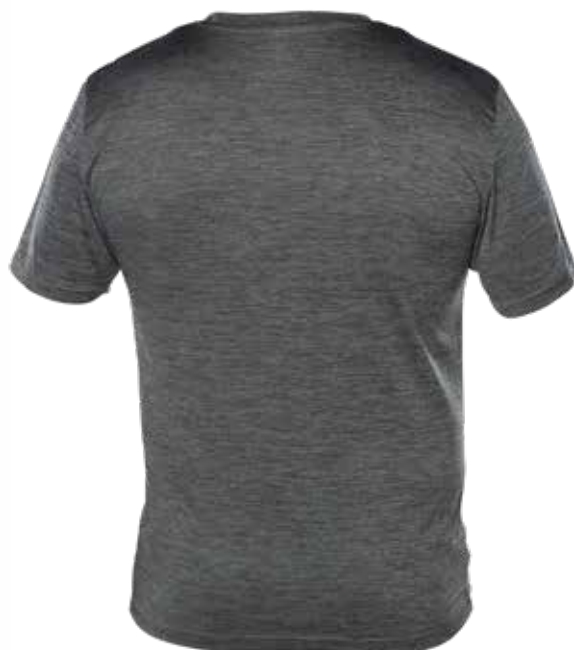
MIX GRIS | MIX GREY - DOS | BACK