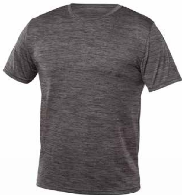
MIX GRIS | MIX GREY - DEVANT | FRONT