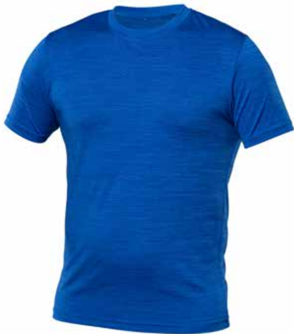
MIX BLEU | MIX BLUE - DEVANT | FRONT