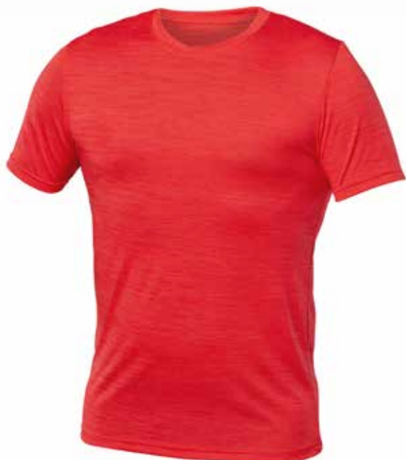
MIX ROUGE | MIX RED - DEVANT | FRONT