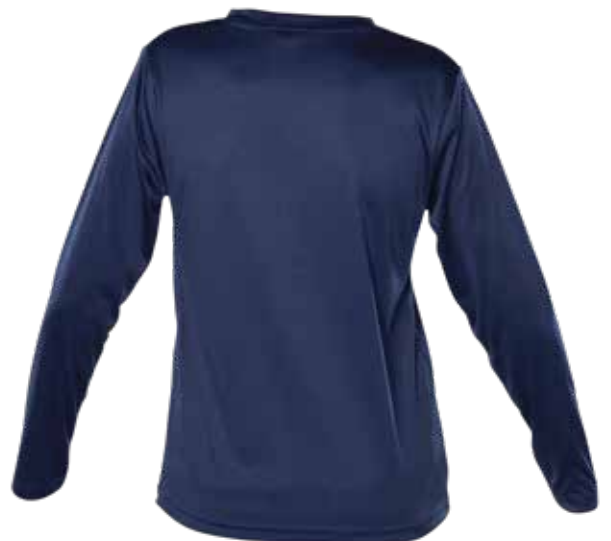
MARINE | NAVY - DEVANT | FRONT