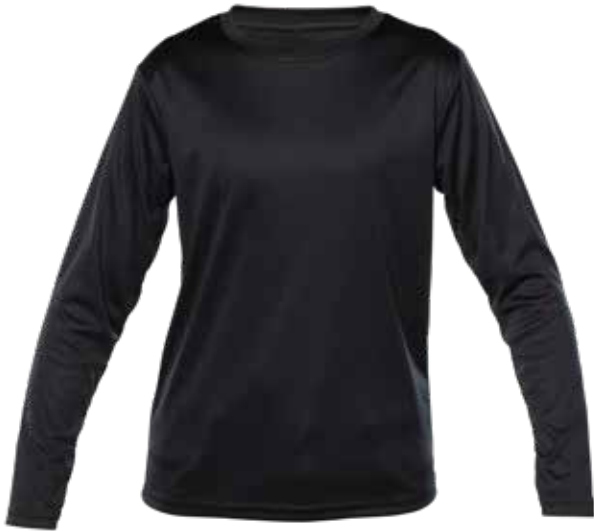
NOIR | BLACK - DEVANT | FRONT