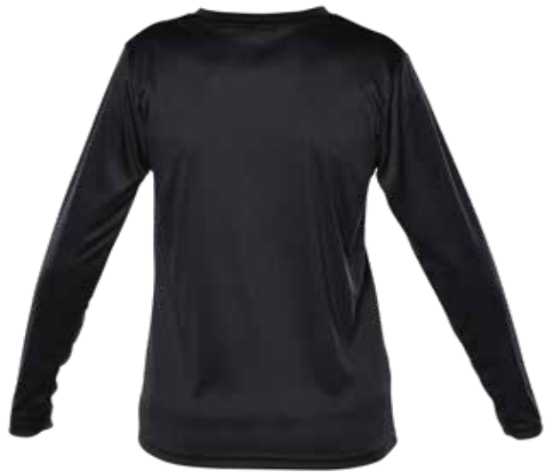
NOIR | BLACK - DOS | BACK