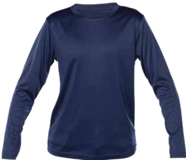
MARINE | NAVY - DEVANT | FRONT